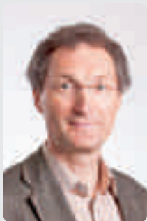
Nico MEYRER comm. de l'environnement & de la politique climatique