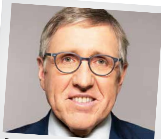
François Bausch, Nachhaltigkeits- und Infrastrukturminister

déi gréng Hesperingen haben Nachhaltigkeits- und Infrastrukturminister François Bausch für eine öffentliche Konferenz nach Hesperingen eingeladen. Anhand einer detaillierten PowerPoint Show wird der Minister die aktuellen Pläne vorstellen und sich anschließend den Fragen des Publikums stellen.