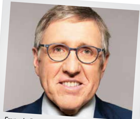
François Bausch, Ministre du Développement durable et des Infrastructures

KONTAKT : TEL.: 36 82 42 HESPER@GRENG.LU WWW.GRENG.LU/HESPER