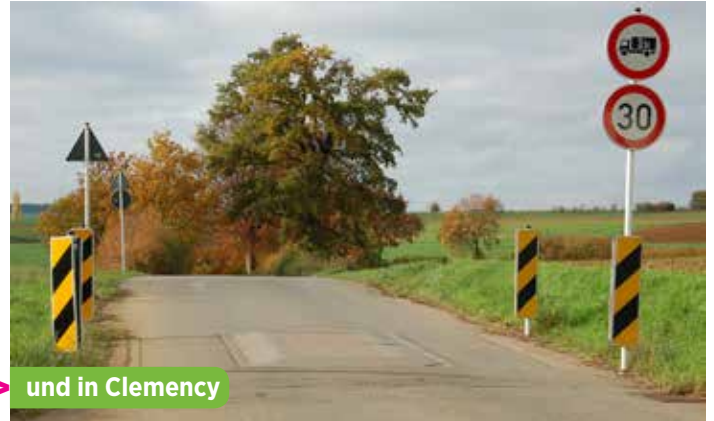
► und in Clemency