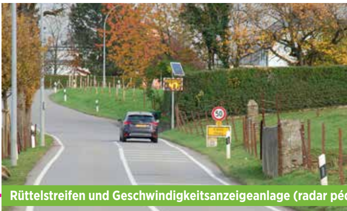
► Rüttelstreifen und Geschwindigkeitsanzeigeanlage (radar pédagogique) in Fingig und Linger