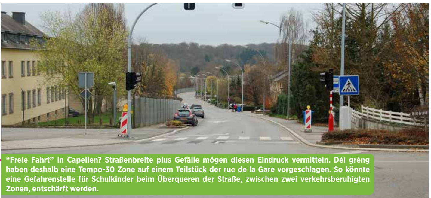
► "Freie Fahrt" in Capellen? Straßenbreite plus Gefälle mögen diesen Eindruck vermitteln. Déi gréng haben deshalb eine Tempo-30 Zone auf einem Teilstück der rue de la Gare vorgeschlagen. So könnte eine Gefahrenstelle für Schulkinder beim Überqueren der Straße, zwischen zwei verkehrsberuhigten Zonen, entschärft werden.