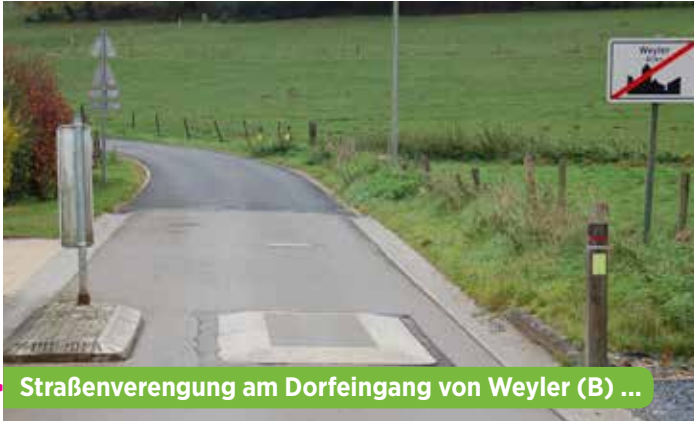
► Straßenverengung am Dorfeingang von Weyler (B) ...

La circulation routière fait partie de la vie de tous les jours. Elle ne se réduit cependant pas à l'automobile seule. En effet, automobilistes, poids-lourds, bus, motocyclistes, cyclistes et piétons se partagent les voies publiques. Vu le pouvoir attribué au collège échevinal par la loi communale de 1988 et par le code de la route modifié de 1955, il est absolument indispensable que celui-ci entreprenne toutes les démarches nécessaires pour que cette coexistence se déroule dans les meilleures conditions possibles !